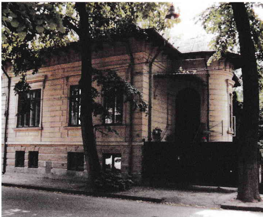
Casa Vasile Voiculescu din Str. Dr. Staicovici, nr. 34-36, București, 1990